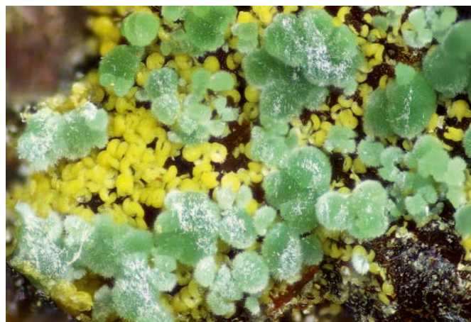
Figura 5. Omsita de la localidad tipo, el depósito de hierro del Correc d'en Llinassos, Oms, Pirineos Orientales, Occitania, Francia; con esferas verdes de glaucoferita. C.V. 2 mm.

Pero si el apoyo institucional a la mineralogía sistemática ha desaparecido prácticamente de Francia, su tradición histórica ha sido retomada, y con entusiasmo,