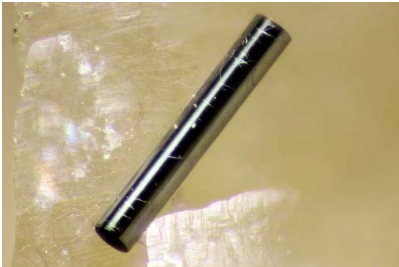
Fig.6. Tubulita de la localidad tipo en França, la cantera Le Rivet, canteras de Peyrebrune (6 km al este-sureste de Réalmont), Tarn, Occitania. Longitud del cilindro: 0,4 mm. Colección: Robert Pecorini; foto: Jean-Marc Johannet (reproducida aquí con su permiso), del libro Minerals with a French connection .

de organización alternativa y resultan extraordinariamente útiles.