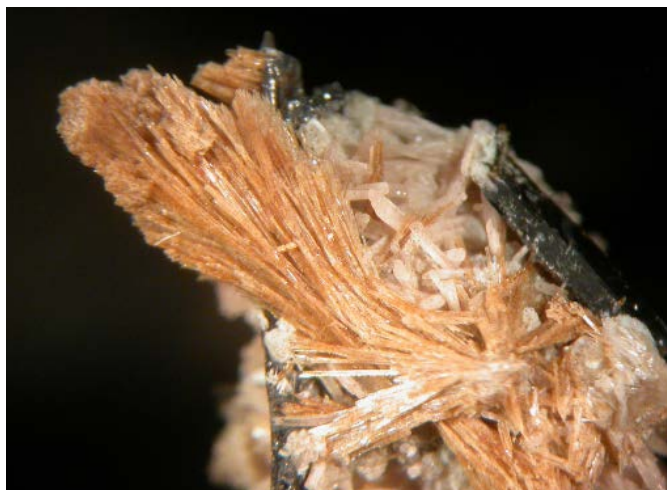
Fig. 2. Bussyita-(Ce) de la localidad tipo, el complejo alcalino de Mont Saint-Hilaire, Montérégie, Quebec, Canadá; con nenadkevichita y aegirina. C.V. 1,2 mm. Colección y foto: Peter Tarassoff (reproducida aquí con su permiso), del libro Minerals with a French connection .

National d'Histoire Naturelle y en 1841 presentó su sección dedicada a la Mineralogía. En 1878, Alfred Louis Olivier Legrand Des Cloizeaux (epónimo del mineral descloizita) fundó la Société Française de Minéralogie et de Cristallographie (SFMC), todavía activa hoy en día y una de las entidades responsables de la publicación de este libro, junto con la Mineralogical Association of Canada. Más recientemente, en 1959, se constituyó el Bureau de Recherches Géologiques et Minières (BRGM), el servicio geológico nacional de Francia, que también participa en la edición de este volumen.