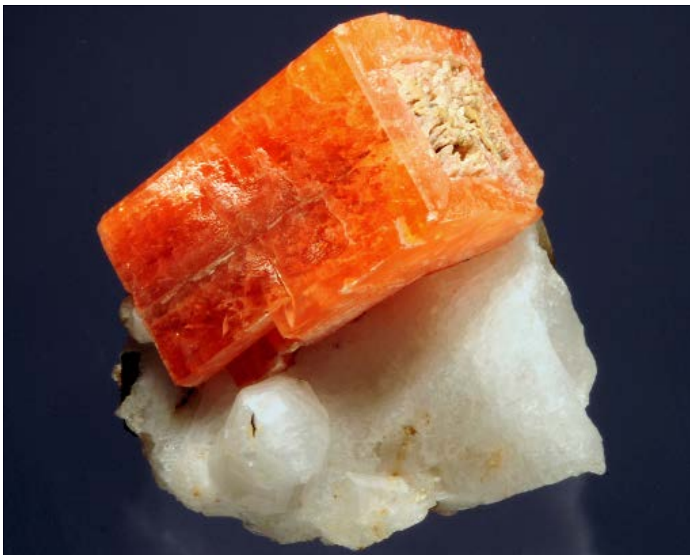
Fig. 3. Serandita de la cantera Poudrette, complejo alcalino de Mont Saint-Hilaire, Montérégie, Quebec, Canadá; con analcima y aegirina. Medida del cristal: 4 x 4 x 7 cm. Colección: Université Laval; foto: László Horváth (reproducida aquí con su permiso), del libro Minerals with a French connection .

Toda esta tradición se ve reflejada en un inmenso listado de científicos franceses de primer nivel que, de una manera u otra, han dejado su impronta en la mineralogía moderna, ya sea desde la geología, la química, la cristalografía, la mineralogía descriptiva y analítica o la física. En muchos casos, sus méritos han sido reconocidos con la denominación de nuevas